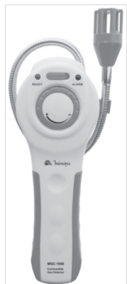
Imagem meramente ilustrativa/Only illustrative image/Imagem meramente ilustrativa/