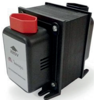
Imagem meramente ilustrativa / Only illustrative image / Imagem meramente ilustrativa

750VA/1010VA/1500VA/2000VA/3000VA/5000VA