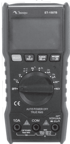
Imagem meramente ilustrativa / Only illustrative image / Imagem meramente ilustrativa.